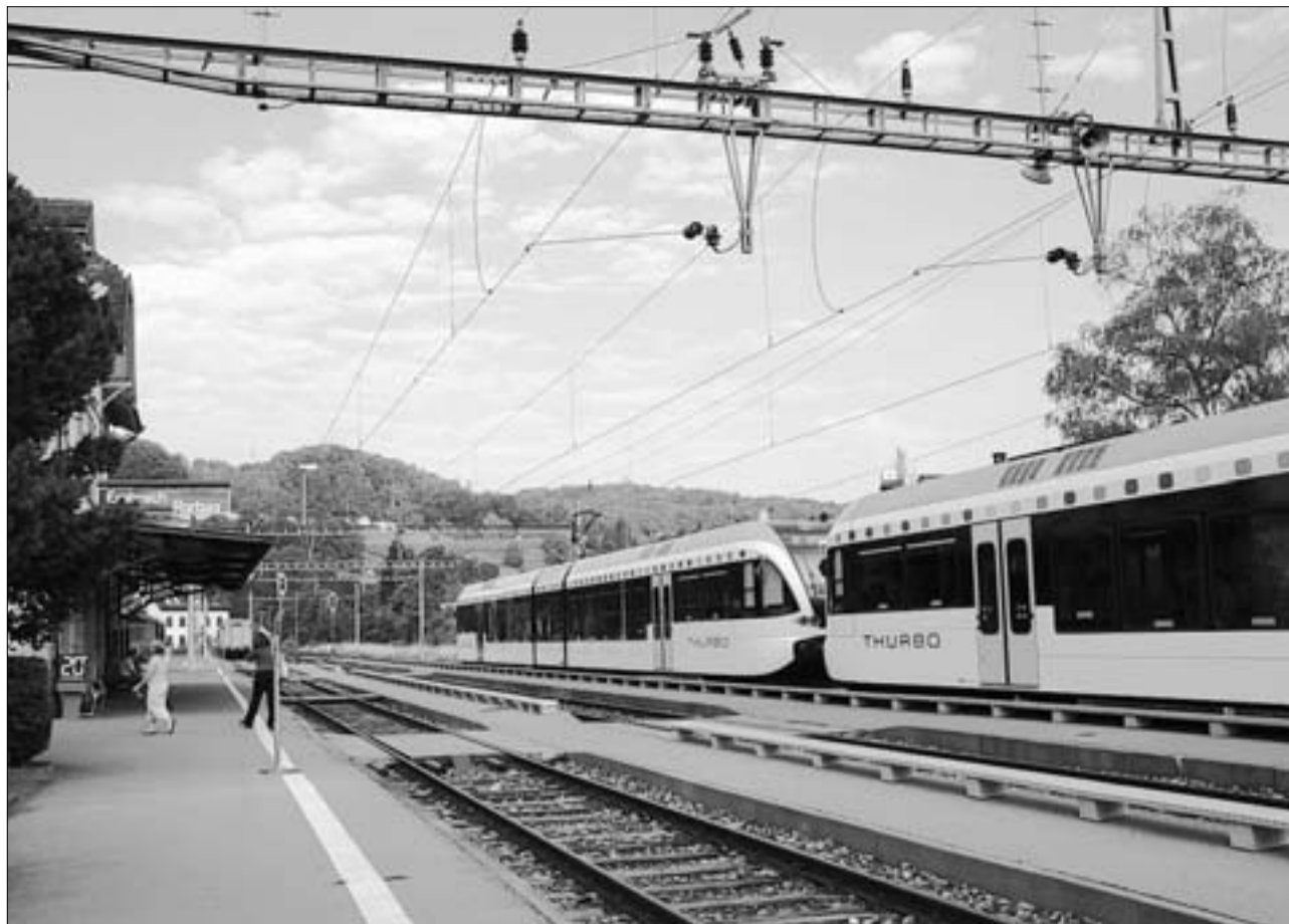
Die S41 hält nach wie vor in Embrach-Rorbas, die Schalterhalle wird aber geschlossen. Seit einiger Zeit verkehrt auf der Strecke Winterthur-Waldshut ein komfortabler, leiser «Thurbo»-Zug. (asa)

EMBRACH / Defizitärer Ticket-Verkauf am Bahnhof