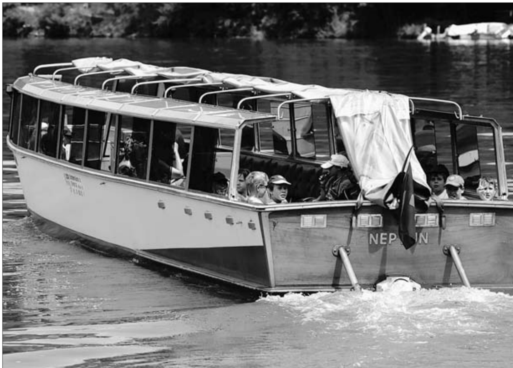
Der Sommer im Bild: Im Schiff Neptun sitzt es sich gemütlich für eine Rheinschiffahrt.

Vorbehalten bleibt die Genehmigung des Voranschlags 2006 durch die Stimmberechtigten an der Budget-Gemeindeversammlung vom 14. Dezember. (ZU)