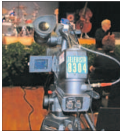
Insgesamt neun Kameras hat Televista für das Konzert exakt ausgerichtet.